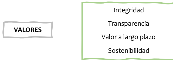
Figura 3: Valores de MIMEISA