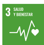
Ilustración 3: En relación con el ODS 3: Salud y bienestar